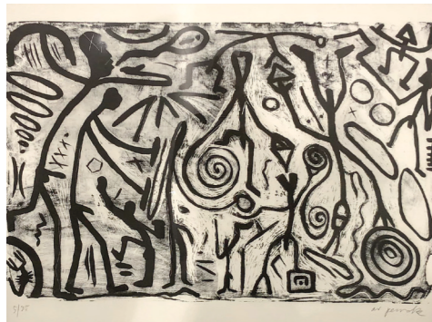
Grafik von A. R. Penck (C)